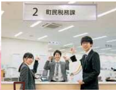
婚姻届を記入し、1階町民税務課にお越しください。