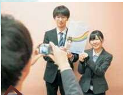
二人の写真を撮影させていただきます。