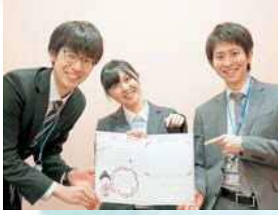
写真が貼られた記念シートが手渡され完了です！