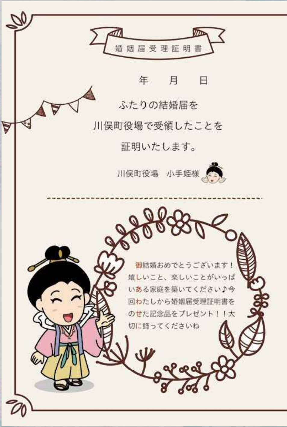
↑婚姻届を提出された方にプレゼントされる記念シート。届出当日の二人の写真が添付されます。

【この事業の概要】 川俣町役場に婚姻届を届け出た方に記念品（記念シートと当日の二人の写真）をプレゼントします。 【対象】 川俣町役場に婚姻届を届け出たカップルが対象で、住所等が川俣町である必要はありません。 【注意点】 休日は記念シートのみをプレゼントになります。 ※写真は平日のみのサービスで、すべて後日の対応はいたしません。