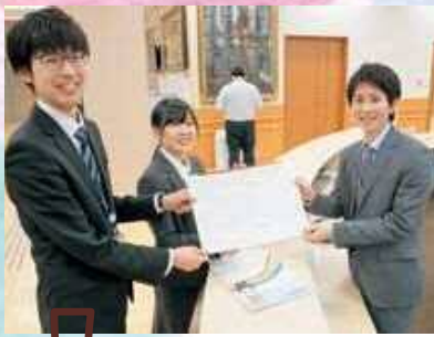
担当者が届け出を受理し、手続きをします。