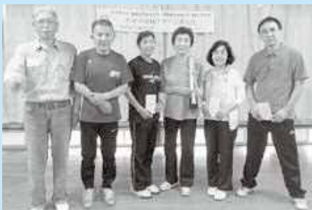
写真は春季卓球大会での 団体優勝チームです

卓球サークル「かすが卓球クラブ」は週3回、趣味と健康保持を兼ねて練習をしています。いつでも好きな時間帯に来て好きなだけプレーを楽しむことができます。また年2回、卓球大会を開催して技術の向上と親睦をはかっています。