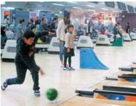
運動不足解消に役立ちましたか？また来年も頑張りますよ！

誰 しもが運動不足になりがちなのが、この時期に毎年行っている、小神体育振興会の主催による「ボウリング大会」が、2月26日に福島オークラブで開催されました。 年々親子での参加者が増え、今年は総勢57名の多くの方に参加していただき、和気あいあいとした雰囲気の中、楽しくボールを投げ合いました。 最後には体育振興会役員の方から全員に、順位によって多種多様な景品が渡され、大人も子どもも笑顔いっぱいの表彰式後、楽しいボウリング大会が終了しました。