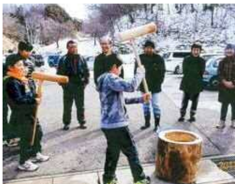
大人も子どもも一緒に楽しめた1日でした。

会食の後には、各学年ごとに壇上へ上がり、自分の自慢の凧を披露し、育成会長より表彰されました。