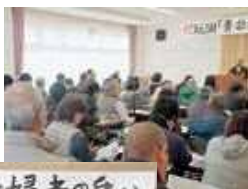
福田地区の輝く未来のためにも、この集いを続けていきます。

最後に基調講演ということで、川俣町長からこれからの川俣町について、お話をいただきました。