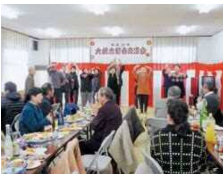
また来年の講演会と交流会が楽しみです。

新 春講演会・交流会が、2月19日に大綱木公民館において開催されました。 講演会は、公民館長のあいさつで始まり、講師の方による「なりすまし詐欺防止」についての落語を聞きました。詐欺の電話対応の仕方など、楽しくお話ししていただきました。 交流会では、初めに自治会長のあいさつや来賓の副町長と町議会議長の祝辞をいただき、長寿クラブ会長の乾杯で交流会が始まりました。健康体操やカラオケ、輪投げ大会や楽しみ抽選会などの出し物で、大いに盛り上がりました。