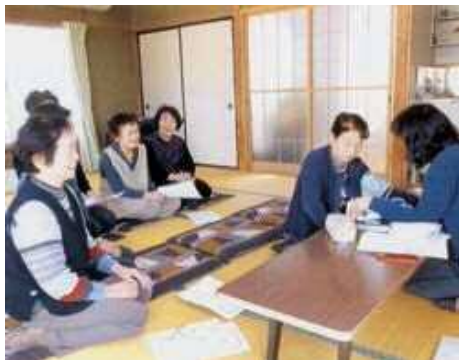
玉ねぎの万能ドレッシングは、血液がサラサラになるため健康に効果絶大です！

日ごろからどんなに減塩に気を付けていても、塩分は摂り過ぎがちになります。そこで、1日に350グラムの野菜を摂ることによってカリウムや食物繊維の働きを活性化させ、脂肪や余分なナトリウムを体外に排出させることで、減塩することができます。積極的に野菜を食べることで調理法を学び、長寿体操をして終了となりました。