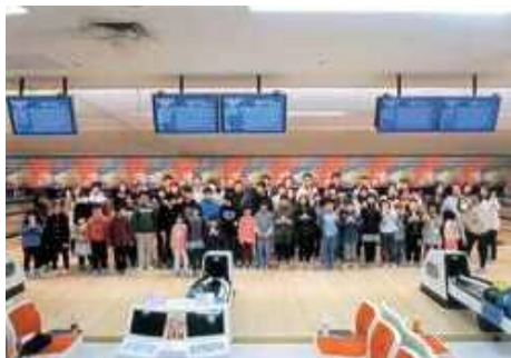
子どもたちも大人たちも、みんなで楽しく交流を図ることができたようです。

4月に新学期を迎える子どもたちの思いと、親との思いがひとつになり、有意義な時間を持てたようです。これからもみんなで、仲良く楽しく学校生活を送れるように願っています。