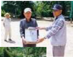
グラウンドゴルフで体力向上をはかり、親睦も深められました。

グラウンドゴルフ会に入って練習している人、初めて参加した人等、和気あいあいのもと真剣にプレーを行い、優勝者は2ゲームトータルで19点という高得点でした。体力向上、交流と親睦がはかられた大会でした。