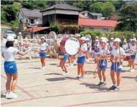
児童の皆さん、暑い中元気に楽しく頑張りました。

4月に入学したばかりの1年生がとても可愛らしく、皆さんの頑張りに胸が熱くなりました。これからも元気に成長して行ってほしいです。