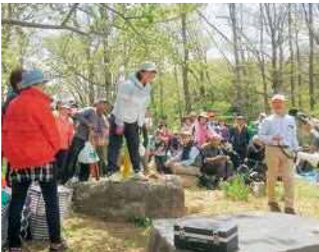
「羽山最高ー!」「〇〇愛してるー!」など、思いっきりさげんでください。

「福沢のおもてなしの心」として、地区民協力により、紅白餅、コースター、竹杖、花の苗など、先着でプレゼント。頂上イベントでは大声コンテスト、お楽しみ抽選会で盛り上げました。羽山下にて、豚汁と玉こんにゃくのござうに東京など県内外からの参加者約300人が笑顔になりました。