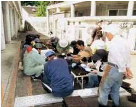
今年も各地区に咲いた花が、皆の心を和ませてくれることと思います。

自治会役員、公民館、行政区長、連絡員の皆さん約40名の協力により、短時間でスムーズに終わることができました。これから約4週間、役員が交代で水撒きをし、6月25日の苗配布まで育苗します。