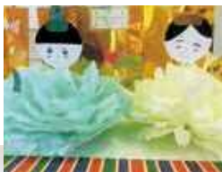
手作りのひな人形はそれぞれ持ち帰ってもらいました。素敵なひな祭りが過ごせたかな？

出来上がったひな人形を飾った後は、ひな人形を眺めながらスタンプが準備したチラシ寿司を食べたり、絵本の読み聞かせなどで楽しいひと時を過ごしました。