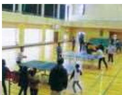
役員のみなさん、企画や準備等ありがとうございました。

親子での参加者も多く、日頃の会話不足も解消され、楽しいひと時を過ごすことができたようです。