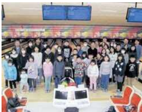
重いボールを投げるのは大変だったけど、みんなとできて楽しかったね！

4月からの新しい中学校生活や新学期に向けて、子どもたちが元気に明るく、大きく成長していく姿が楽しみです。