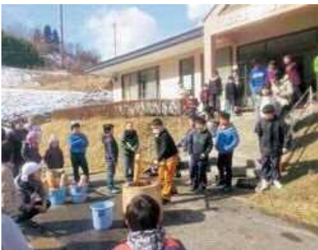
「餅上手くつげよー！セーの！」ガッツウン！「白にぶつつげだ！」杵は重いし、難しい！

建 国記念日に二部構成で、福田地区の第44回餅つき・凧あげ大会が開催されました。第一部は羽山の森美術館で、各学年が自作の凧をあげて競争しました。風に乗る糸が切れ、美術館の屋上や桜の枝に絡り止まる凧もありました。親子で参加した方は、「自分たちの凧あげを思い出し、懐かしいない」と笑顔でした。第二部は福沢公民館に移動し、白での餅つきを子供たちに体験してもらいました。美味しいあんこ餅と雑煮餅を食べ、凧あげ大会の表彰式が各学年ごとに行われました。