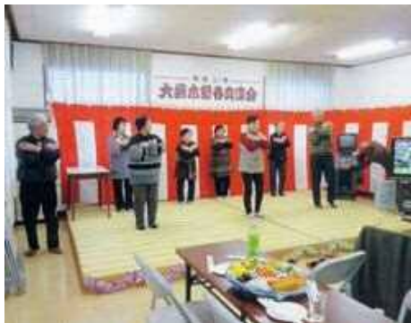
みなさんの出し物のおかげで、楽しく交流を深めることができました。