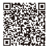
国税庁動画チャンネル QRコード