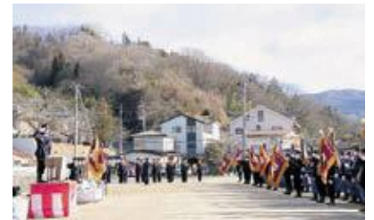
◁長年の消防活動お疲れ様です！

1月7日、川俣小学校で川俣町消防団出初式が開催され、約330名の団員が参加しました。また、同時に行われた山形精勤表彰では地域の消防活動に長年従事した消防団員ら98名の団員が表彰を受けました。空気が乾燥するシーズンを迎え、福島県内でも火事が相次いで起きています。今後も「防災・減災」の意識を持ち安全・安心な町を目指しましょう！