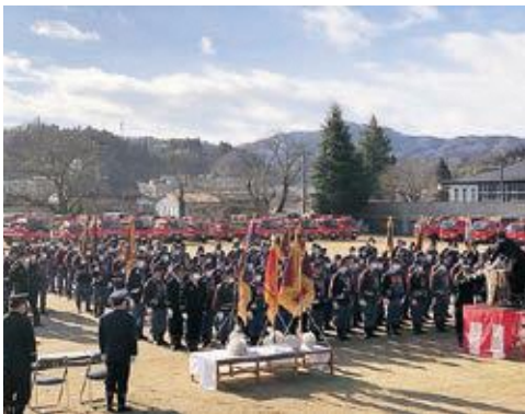
表彰された団員の皆様、おめでとうございます！

宮赤地区からも2名の方が、それぞれ5年と10年で表彰されました。活動された年月の中には町内の火災に昼夜問わず出勤したり、空気が乾燥する真冬に夜廻りをしたり、ご苦労も多かったと思います。私たちもなお一層火の用心を心掛けたと思います。私達の生命と財産を守るため活動いただいている事に敬意を表すると共に、これからも健康に気を付けて安全に活動していただきたいと思います。