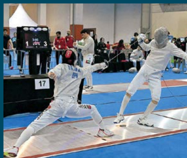
アジア・カデ選手権大会

今の直近の目標は高校生活の集大成となるインハイで優勝することです。世界でもに戦った仲間と相対するため、お互い手の内を知った状態での試合になりますが、油断せず、優勝できるように日々の練習に取り組んでいきたいと思っています。