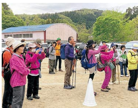
登山者は、開催式で行われた『羽山太鼓』の演奏を撮影していました。いざ！6(む)10(とう)3(さん)へ。

山頂の羽山神社では、『大声コンテスト』と『お楽しみ抽選会』をしました。コース途中の臼吉神社登山口では、豚汁と冷たい麦茶を振る舞い、塩分と水分を補給してもらいました。毎年、福沢羽山を満喫してもらえよう、地域の皆さんで準備をしています。皆さんの地域を思う活動に感謝です。