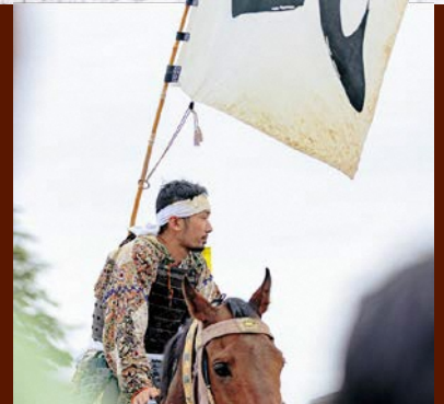
武の旗を掲げる改さん