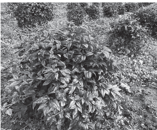
収穫時期のオタフクナンテン