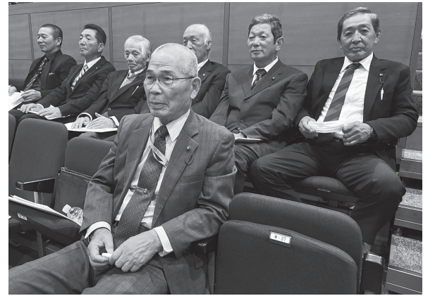
大変興味深い記念講演でした