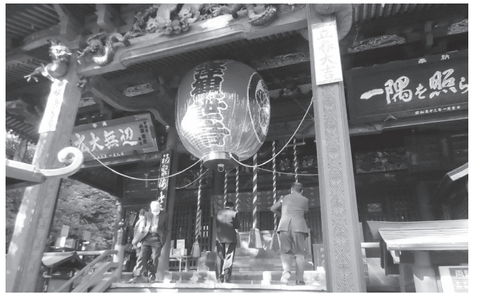
水澤観世音 (群馬県渋川市)

帳等のデータを基に自動更新を可能とすることで、常に最新の情報を確認できるようにしたとのこととです。また、衛星画像データを活用した耕作状況等の判読により、遊休農地区分の分類や、進入困難な山間部の農地の状況確認について、現地に足を運ぶことなく実施が可能となり、利用状況調査において大幅な効率化と負担軽減を図ることができているとのこととです。その他にも、衛星画像を基にして農地利用状況調査時に利用する図面を定型化し、調査票と合わせて出力を可能とすることにより、調査準備に要する時間の短縮も図っているとのこととです。タブレットについては、地区担当の委員2人に対して1台を配布する運用で、推進委員がメインで活用している状況ですが、一方の活動に