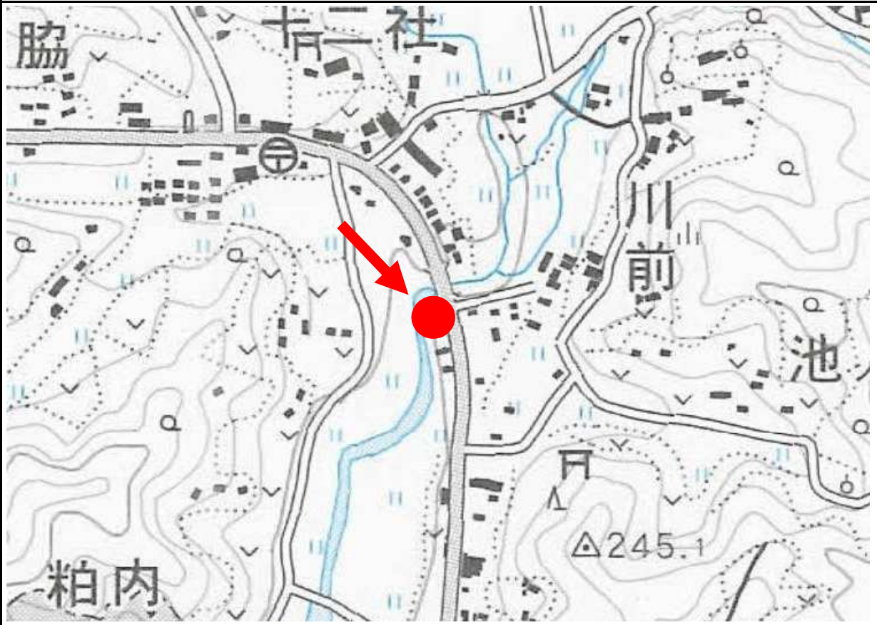
(11) 配置図・間取り図