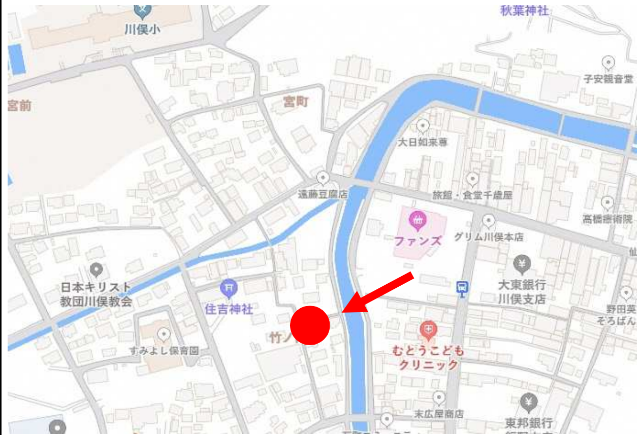
(11) 配置図・間取り図